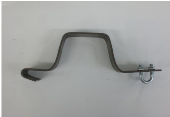
無溶接フープ筋取付型